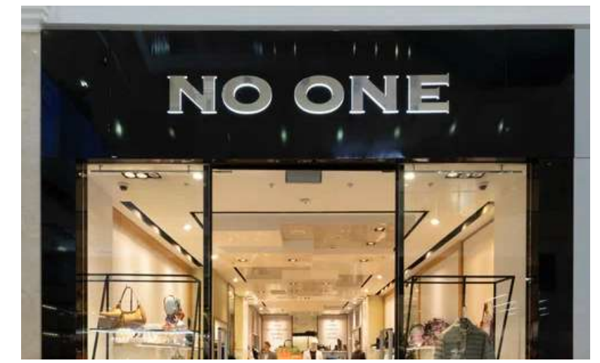
NO ONE Moscow