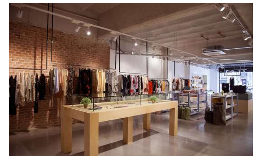
SUEÑOS NEGROS Barcelona