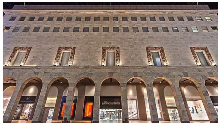
LA RINASCENTE Milano