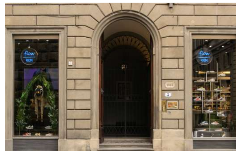
FLOW RUN Firenze