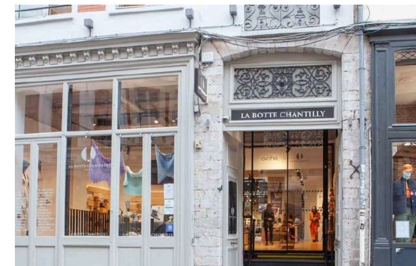
LA BOTTE CHANTILLY Lille