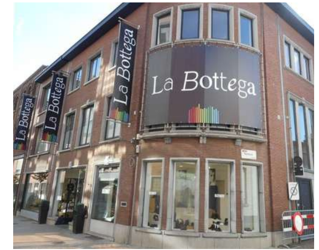
La Bottega, Hasselt