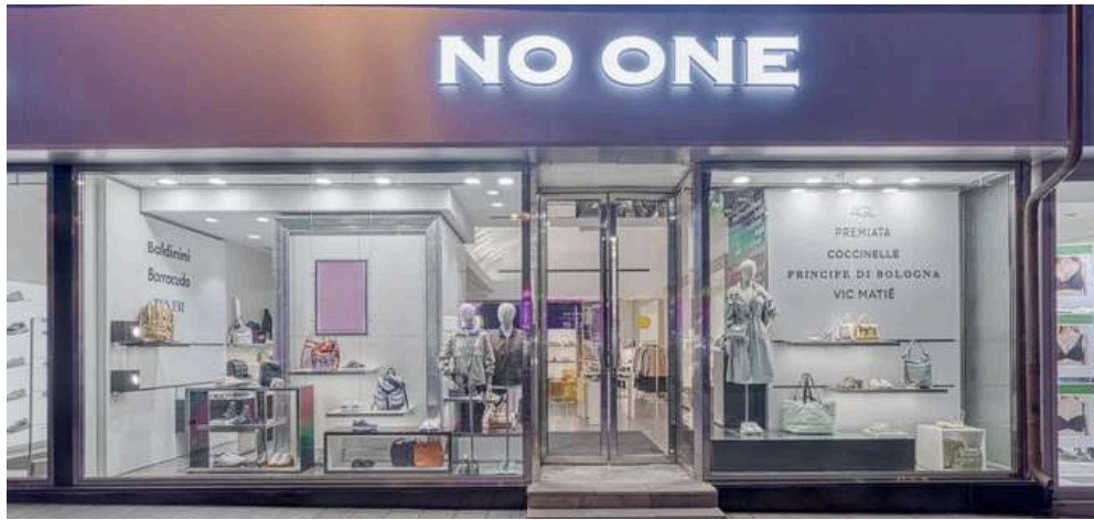
No One, Russia